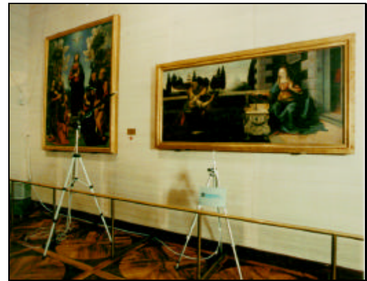
Misure termoigrometriche in una Sala Museale

Per migliorare la gestione e la fruizione al pubblico del materiale cartaceo, Syremont dispone di soluzioni personalizzate per ogni singolo problema, al fine di ottimizzarne l'uso.